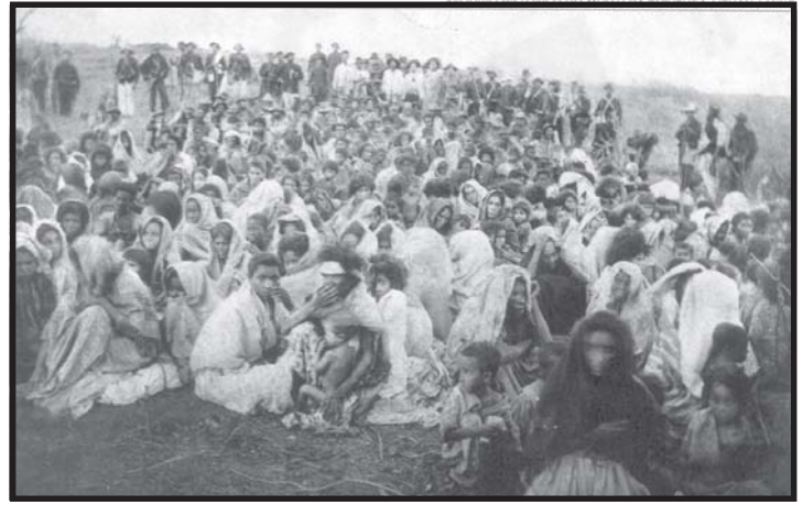
“400 jagunços prisioneiros, fotografia de Flávio Barros, de 1894”. Revista “Nossa História”. Ano 3/nº30/Abril 2006

Entre os séculos XIX e XX, diversos movimentos de cunho político-religioso espalharam-se por quase todas as regiões do Brasil e convulsionaram a sociedade brasileira. A partir disso, assinale a única alternativa incorreta :